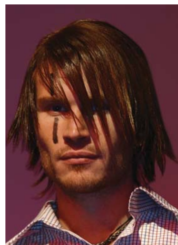
Die Frisurentrends unserer Elite-Salons geben international den Ton an