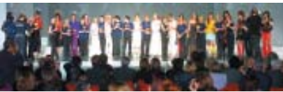
Anerkennung und Prestige mit der freundschaftlichen Unterstützung aller Intercoiffure-Mitglieder

Der Weg zur Perfektion in vielen Städten der Welt, ganz nahe bei den Mitgliedern • Live die neuesten Trends und Techniken aus Paris mit Elite-Akteuren des Teams Créateurs d'Intercoiffure • Marketingreferate von ausgewiesenen Branchenexperten