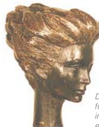
Die Guillaume-Skulptur – für viele der Meilenstein im Hinblick auf eine erfolgreiche Zukunft