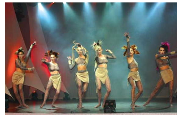
Spannung, Action und Ideen begleiten jeden Event