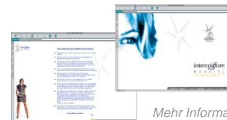
Mehr Informationen und tagesaktuelle News unter www.intercoiffure-mondial.com