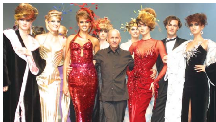
Bühne frei für die aktuellsten Trends aus aller Welt