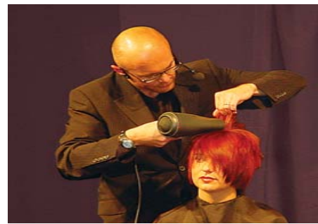
... und eine außergewöhnliche Beratungsleistung zeichnen die Elite-Friseure von Intercoiffure aus