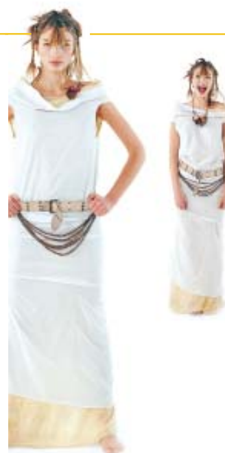
Licht aus – Spot an! Hier besteht nur, wer Kreativität und Technik perfekt vereint

Ob frisch und cool oder feminin-romantisch – „Hauptsache überraschend“ lautet die Devise der internationalen Elite der Friseure. Im Rahmen der saisonalen Kollektionen Frühjahr/Sommer und Herbst/Winter erhalten alle Intercoiffure-Mitglieder und die Presse Fotos und eine CD-ROM mit den aktuellsten Trends und Tendenzen aus aller Welt. Eine unersetzliche Bereicherung für jeden Salon!