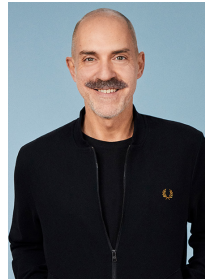
ALEXIS FERRER Ambassadeur Mondial Wella